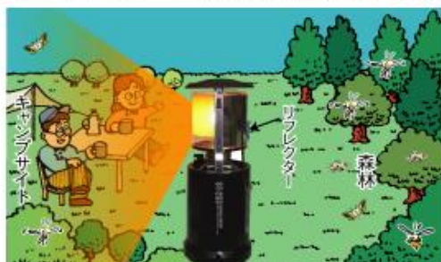
リフレクター装着