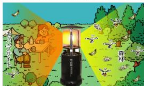
リフレクターなし 余分なひかりで森林から虫を寄せている