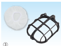
③ 清涼ファン風雅ボディ2用 フィルターフレーム付きセット (交換用フィルター10枚付)