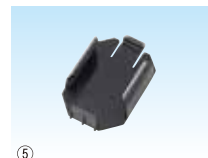
⑤ リチウムイオン充電電池 BT7225用ホルダー