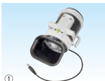
① 清涼ファン風雅ボディ2 ファンユニット