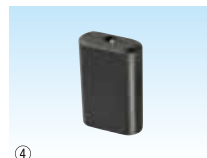
④ リチウムイオン充電電池 BT7225