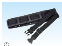
② 清涼ファン風雅ボディ2 ベルト