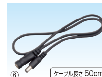
⑥ 延長ケーブルDC 風雅ボディバッテリー FB-BT7455BK 使用時の接続用延長ケーブル ケーブル長さ 50cm