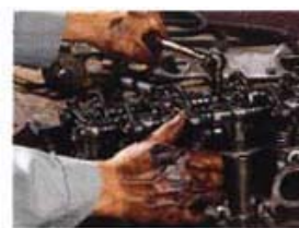
こんな頑固な汚れも

スクラブは、ザラザラ面(軽石効果)と滑らか面(仕上げ拭き)のダブルサーフェス加工ですので汚れを擦り落すことも仕上げ拭きも1枚ですみます。