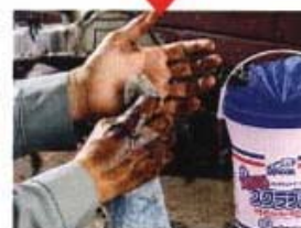
サッと拭くだけで