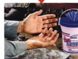
こんなにきれいに!