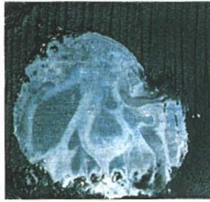
パワークリーナー