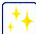
高品質ポリエステル