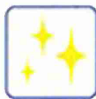
高品質ポリエステル