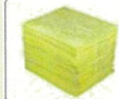
HAZMAT Sorbent Pads