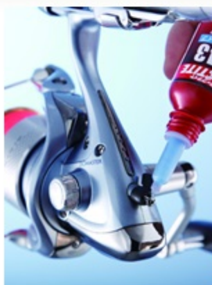
汎用一般ねじのゆるみ止めに。