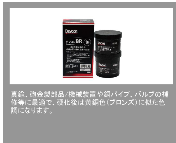
真鍮、砲金製部品/機械装置や銅パイプ、バルブの補修等に最適で、硬化後は黄銅色(ブロンズ)に似た色調になります。