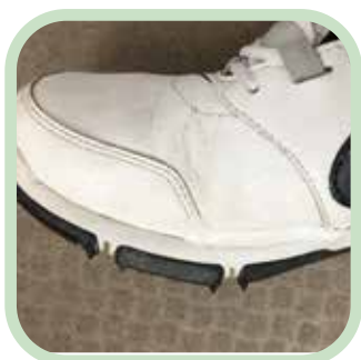
ゴルフシューズのはがれに