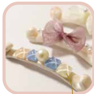
マスククリップ パーツが簡単に付けられるから アクセサリ製作に！