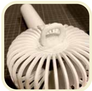
ハンディ扇風機+フック