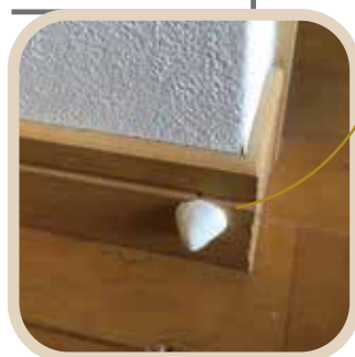
戸当たりクッション