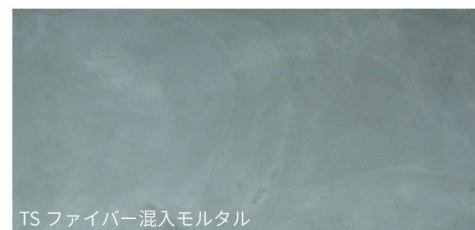
TS ファイバー混入モルタル