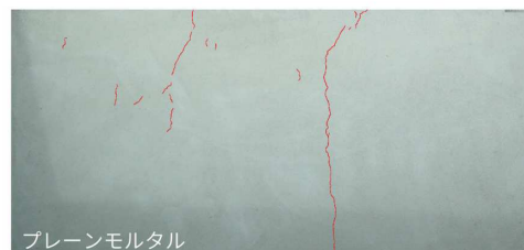
プレーンモルタル

同一条件下で養生を行った試験体のひび割れ発生状況を観察した ところ、高いひび割れ抑制効果が確認されました。