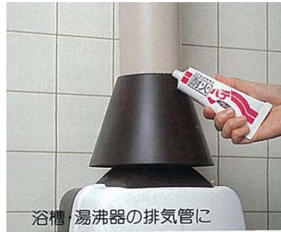
浴槽・湯沸器の排気管に