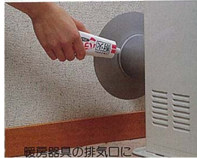
暖房器具の排気口に