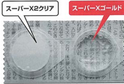
▲厚さ7mmで硬化させた接着剤