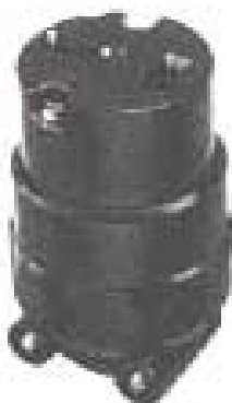
3M端子 2P 20A コネクタースタンプ(3M) 20A. 250V.