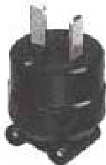
3M端子 2P 20Aプラグ(3M) 20A. 250V.