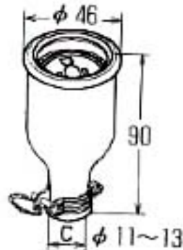
EA940BN-2 15A 125V 接地防水コネクターポデー 15A. 125V