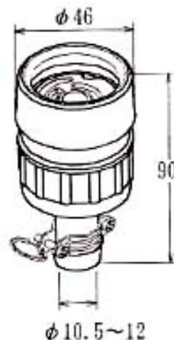
EA940BT-2 2P 15A 引掛防水コネクターボデー 15A. 125V.