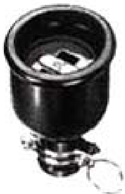
EA940BU-2 2P 15A 防水コネクタボディ 15A. 125V.