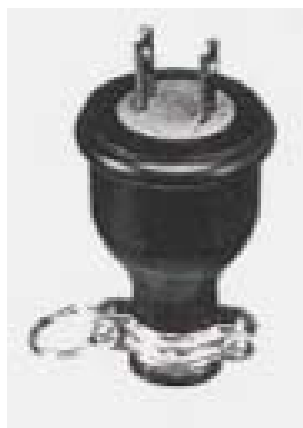
EA940BU-1 2P 15A 防水プラグ 15A. 125V.