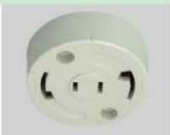
コンセント付 引掛露出ローゼットボディ 1384 PW