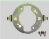
丸形引掛シーリング1384用ハンガー 16155