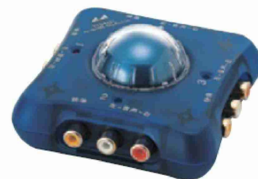
31GMSL(SB) スケルトンブルー