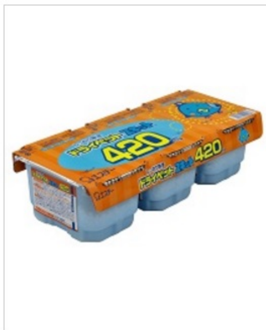
ドライペット スキット