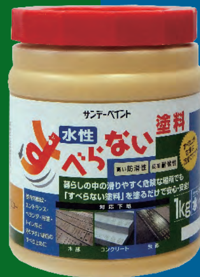
【商品名】すべらない塗料

屋内外階段・エントランス・ベランダ・浴室・トイレなど滑りやすい場所のすべり止めに