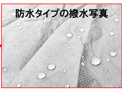
防水タイプの撥水写真