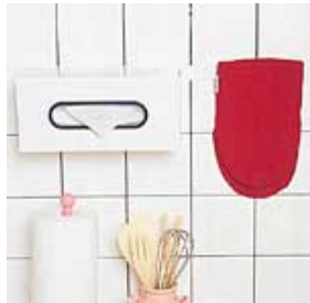
台所などの小物の固定に。