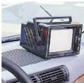
自動車の内装用品の固定に。