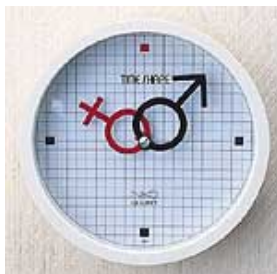
壁面への小物の取り付けに。