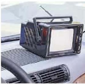
自動車の内装用品の固定に。