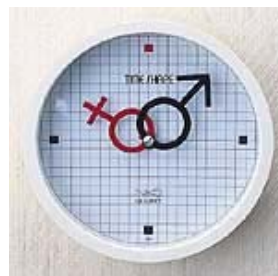
壁面への小物の取り付けに。