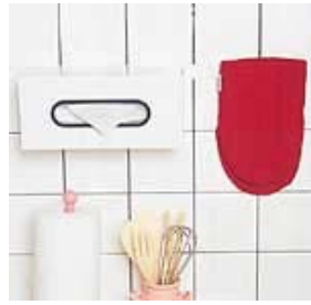
台所などの小物の固定に。