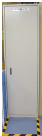
配電盤の前の物置防止に