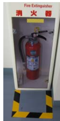
消火器の前の物置防止に