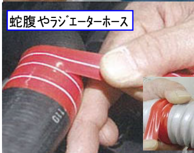
蛇腹やラジエーターホース