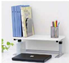
天板を下段にセットするとCDケースにぴったりサイズ