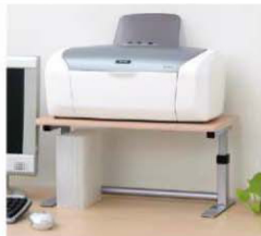
天板を上段にセットするとDVDツールケースにぴったりサイズ