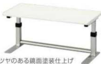
ツヤのある鏡面塗装仕上げ W(ホワイト)