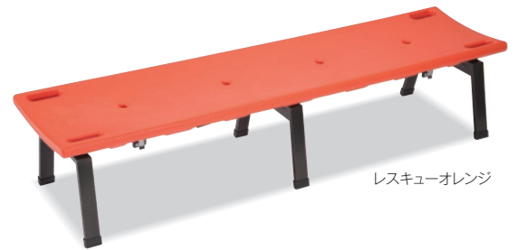
レスキューオレンジ