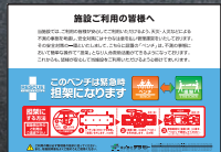
メッセージボールパネル付

操作説明用ツールも別途申し受けます。操作方法を分かりやすく説明。ベンチの側に提示することで緊急時に対応しやすくなります。詳しくは、弊社または係員までお問い合わせください。