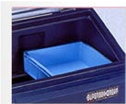
収納に便利な中皿付