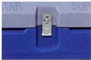
蝶番、バックルはサビに強いステンレス使用