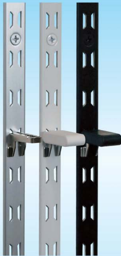
棚柱 (4本入) シルバー・ホワイト・ブラック