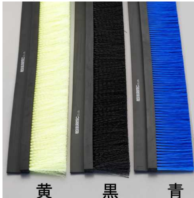
黄 黒 青