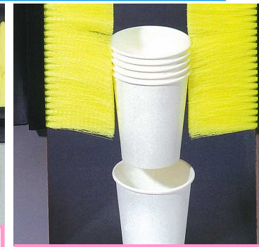
カップを一つずつ取り出す為のガイド