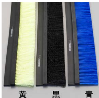
黄 黒 青