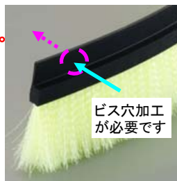
ビス穴加工 が必要です