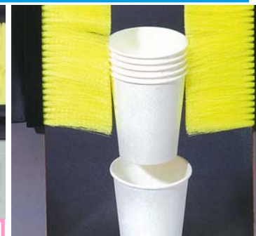
カップを一つずつ取り出す為のガイド