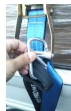
フックは金具で固定