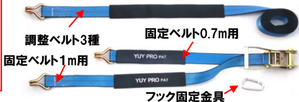
調整ベルト3種 固定ベルト1m用