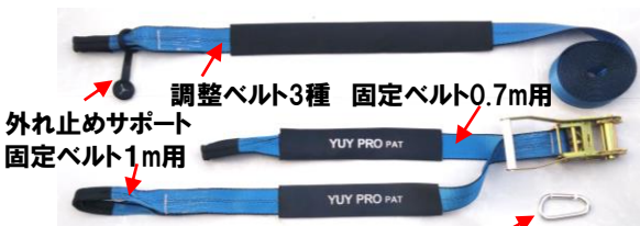
外れ止めサポート 固定ベルト1m用