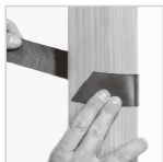
対象物にしっかり巻き付けます (カットも可能)