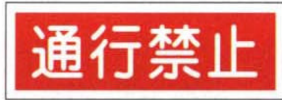
AC - 12