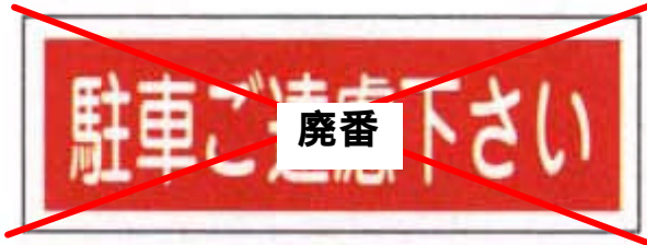
AC - 15 (2007/05/24 廃番)