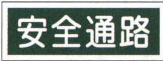
AC - 13