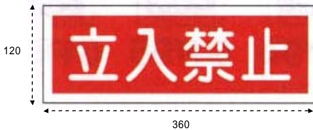
AC - 11