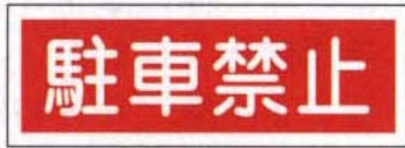
AC - 14