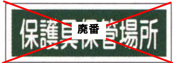
AC - 17 (2007/05/24 廃番)