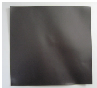
裏面（樹脂マグネット）