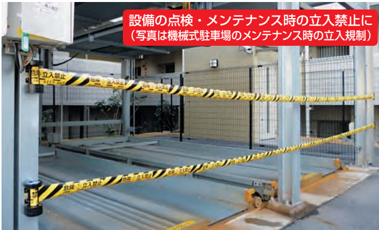
設備の点検・メンテナンス時の立入禁止に (写真は機械式駐車場のメンテナンス時の立入規制)