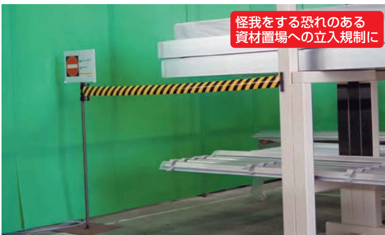
怪我をする恐れのある 資材置場への立入規制に