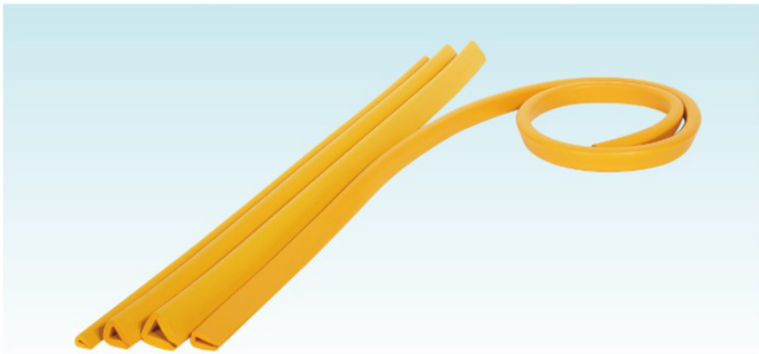
AC-128 AC-86 AC-85 AC-87