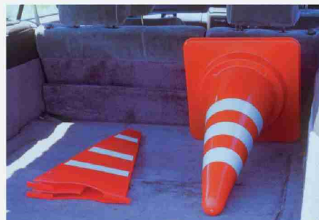
■ ウェイト (385-41)