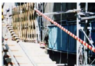
工事現場の手すり