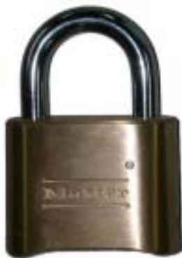
リセットキー(付属)

*セットした新しい番号は決して忘れないでください。 次の番号変更は新しい番号からスタートしてください。