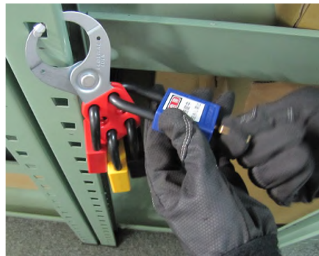
最大6重に(6人で)管理可能。