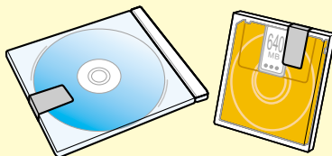
CD・DVD・MOなどの開封確認用に