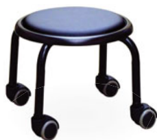
ブラック／ブラック