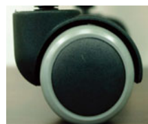
床にやさしい ウレタンキャスター