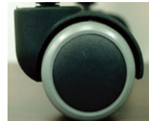
床にやさしい ウレタンキャスター