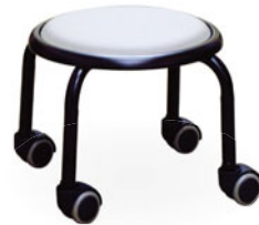
ホワイト／ブラック