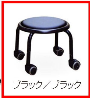
ブラック／ブラック