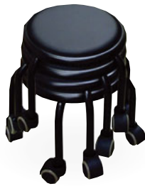
未使用時は スタッキング できます