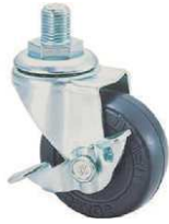
SR-50 RM S-1