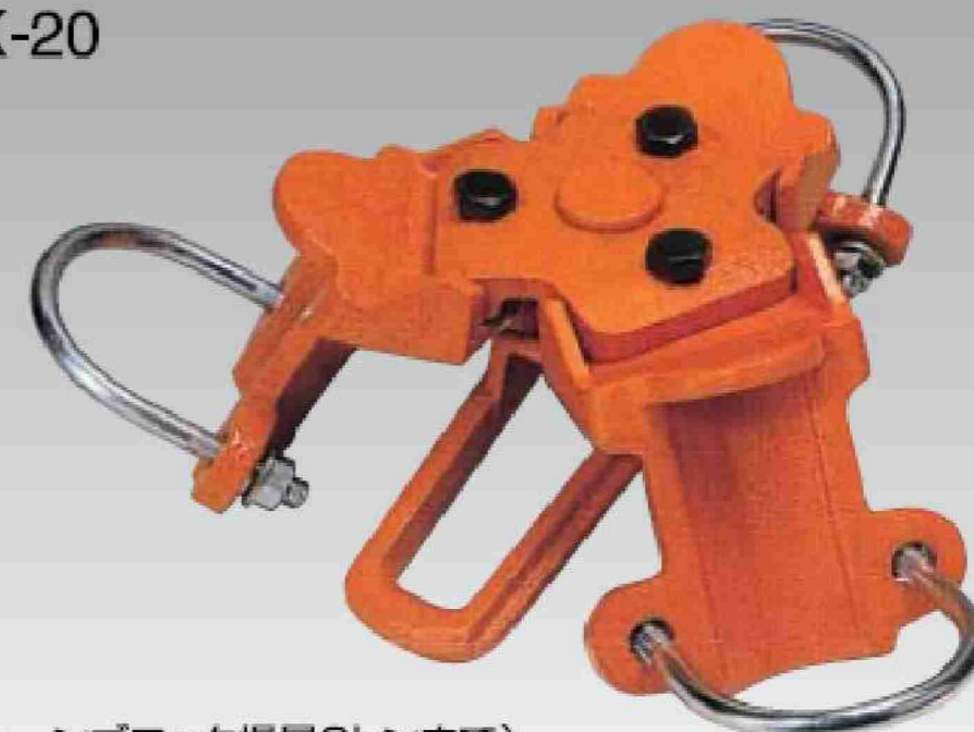
(チェーンブロック揚量2トンまで)