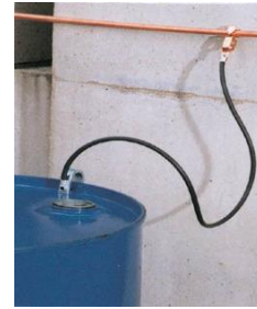
(例)EA991JP-2 アースクリップワイヤー使用