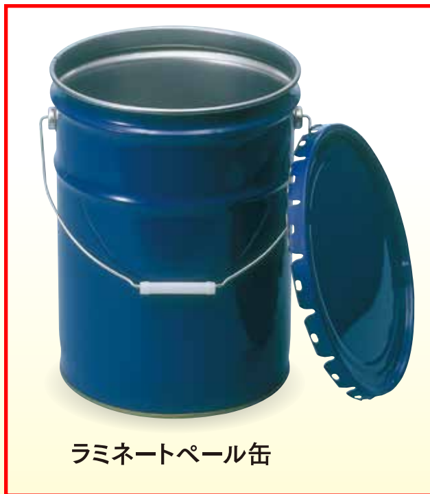
ラミネートペール缶