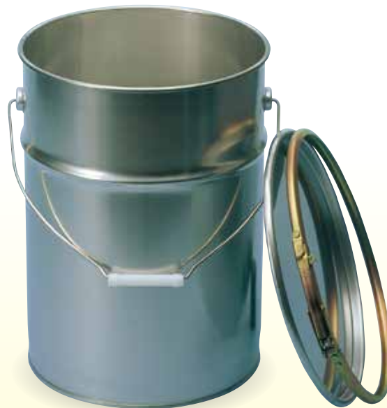
ステンレスペール缶