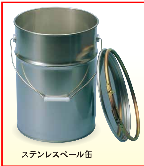
ステンレスペール缶